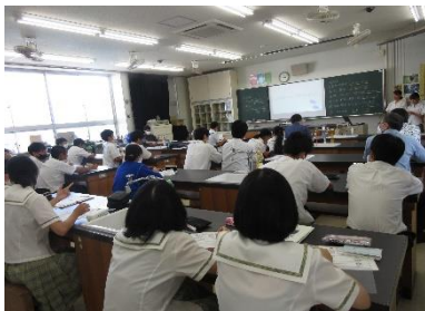
(生物：生徒同士の質疑応答)