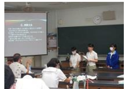
(化学：教授による助言)