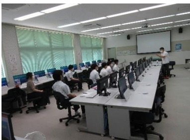
(情報：琉大工学部教授による助言)