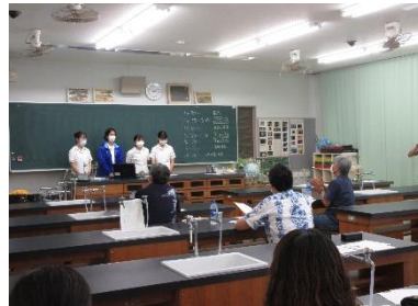
(地学：専門家及び他校教諭も参加)