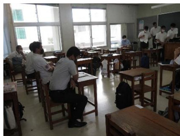
(数学：教授を交えた発表会)