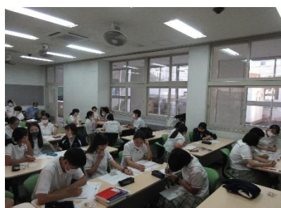
【グループ討議の様子】