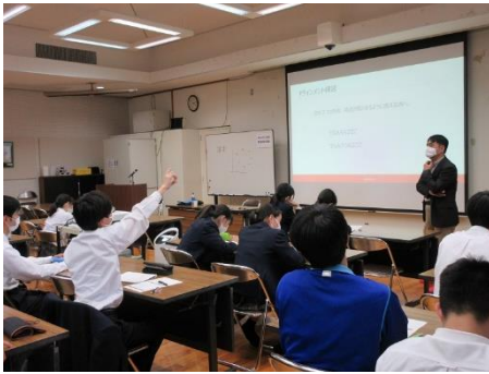
【情報分野：授業風景】

本校 SS リテラシーでは、生徒が 2 年 SS 課題探究 I の研究分野を決定するために 1 年生向け特別授業を琉球大学(6 領域: 理科 4 領域 + 数学 + 情報)の先生方を講師に招き実施しています。生徒は希望する 4 領域の特別授業を受講します。以下は 12 月 8 および 10 日授業の様子です。