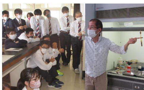
【化学分野：照屋教授の特別授業】