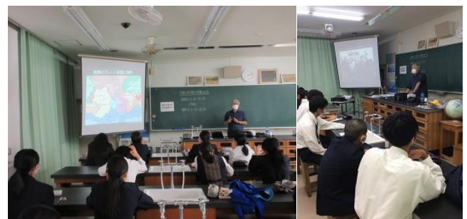
【地学分野：古川教授の特別授業】

物理分野(上図)は理学部准教授による講義で、おもちゃに利用されている物理の原理から最新の研究ニュートリノの話まで興味深い内容で、生徒が前のめりになって講義を受講する様子が見られました。