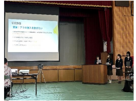
【生物：校内におけるアリ類の生息環境と分布】