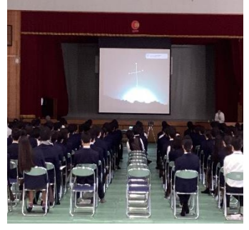
【南十字星の観測映像】