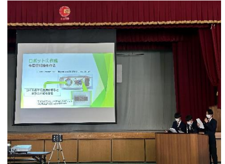
【情報：地雷の無い未来へ】