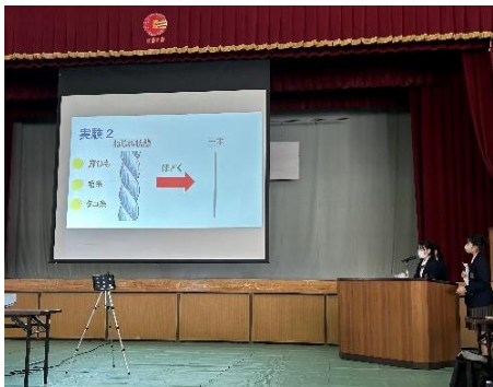
【物理：糸電話の糸の材質と音の大きさの関係】

講演会の後、生徒研究発表会が体育館舞台にて行われました。2 年理科科 6 グループ、国文・普通科代表グループ、サイエンス部によるステージ発表で、そのうち化学分野は英語での発表を行いました。