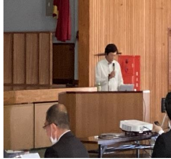
【特別講演会の様子】

2 月 16 日本校体育館で「向陽 SSH 生徒研究発表会」並びに「特別講演会」を実施しました。生徒の発表に先立って行われた「特別講演会」は沖縄科学技術大学院大学 (OIST) 学術連携推進シニアマネージャーの森田洋平氏による講演「『科学の花』をそだてる」でした。「科学の芽」を育てていく奥深さ・面白さについて先生ご自身の経験を交えてご講話して頂きました。また様々な出会いやきっかけは点と点が結ばれていくように人生にいい意味をもたらしてくれるというとても興味深い内容でした。