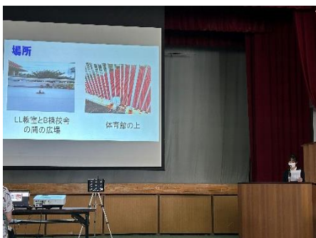
【地学：雨水の酸性度と気象要素の関係】