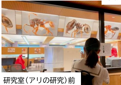
研究室 (アリの研究) 前

初めて OIST に行ってみて、外国の方がたくさんいて、施設も沖縄にいるのに沖縄ではない感じがしました。