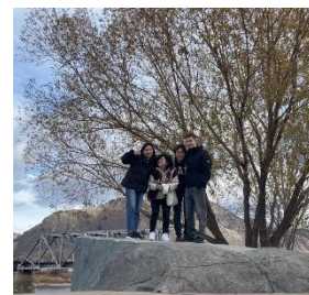
仲間たち（ニックネームは左から Friedrich, Reinhardt, Franz, 少年）

最後に、環境に慣れてきたとはいえ、私の英語力はまだまだです。カナダは比較的日本人もいる方で、その上インターネットを開けば、簡単に日本語に触れることができます。なので、外国に住んでいるだけでは英語力は伸びません。いかに積極的に話しかけるかどうかだと思います。自分が話しかけない限り、大体は話しかけてくれません。留学してまだたったの三ヶ月ほどですが、沢山きつい思いも楽しい経験もしてきました。残りの 7 ヶ月もしっかり色々な事に触れ、学び、経験してカッコよくなって帰国したいです。