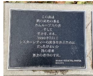
姉妹都市宇治市との契約署名。

私はカナダの西海岸側にあるブリティッシュコロンビア州のカムループスというすごく小さな街に住んでいます。治安はものすごく良く、人々も優しく、差別は全くと言っていいほどありません。なぜならここは白人の次にアジア人が多く、黒人は比較的少ないからです。そして留学生もめっちゃめっちゃ多いので、英語はもちろん、中国語、ポルトガル語、スペイン語、聞いたことすらない言語を話す人々も多いです。また、カムループスは京都の宇治市と姉妹都市で、記念の石碑があります。（右写真）