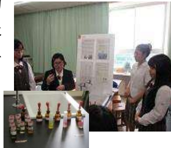
【県産品の香り使った入浴剤づくり】

11 月 28 日(木)に 30 分×2 回で相互発表を行う形式で、他の生徒の研究を聴講した後、ルーブリック表に照らしながら評価し合いました。発表にも様々な工夫が見られ、磯の生き物調査ではエビやカニの標本を作成したり、味覚の研究では薄めた糖分を感じられるかテイステングを体験し、数学ではトランプの実演などもありました。