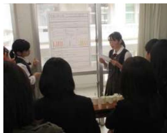
【味覚の個人差 発表】