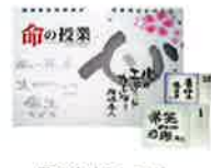
日めくりカレンダー 『心のエピソードカレンダー』