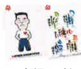
クリアファイル 2種 × 2枚 set