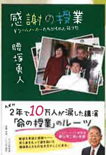
『感謝の授業』 PHP 研究所

活動開始から九年で全国、海外で、一八〇〇講演! 六〇万人の方に聴いていただくことが出来ました。