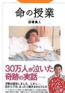
『命の授業』 ダイヤモンド社