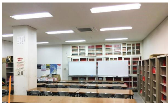
↑この柱めっちゃ邪魔なんだけど・・・ 静かに勉強できる快適空間☆

青いカーテンで仕切られて、1,2年生には敷居が高いワ…と感じるかも知れませんが 早朝講座の前やお昼休み、放課後に開放して、静かに勉強するスペース を設けています。進路に関して知りたい情報が全部揃っているので怖がらずに入ってみよう!