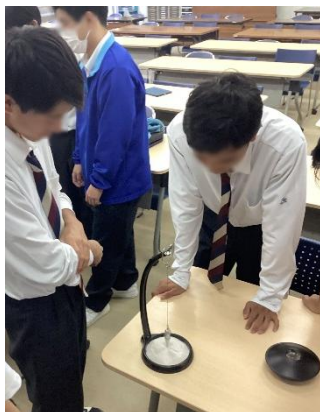
振り子が砂に描く模様が独特～